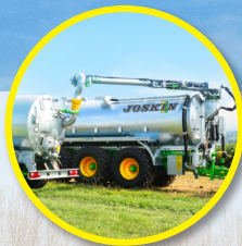
Flèche dorsale pour une aspiration aisée sur tonneau de transport